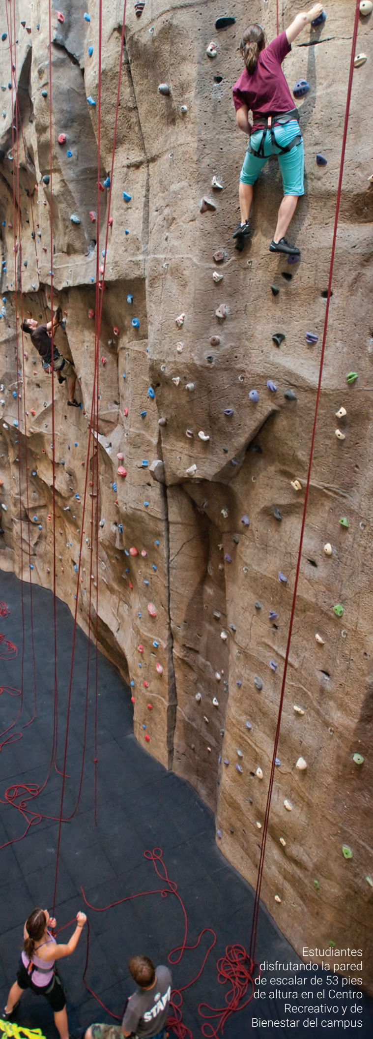
Estudiantes disfrutando la pared de escalar de 53 pies de altura en el Centro Recreativo y de Bienestar del campus